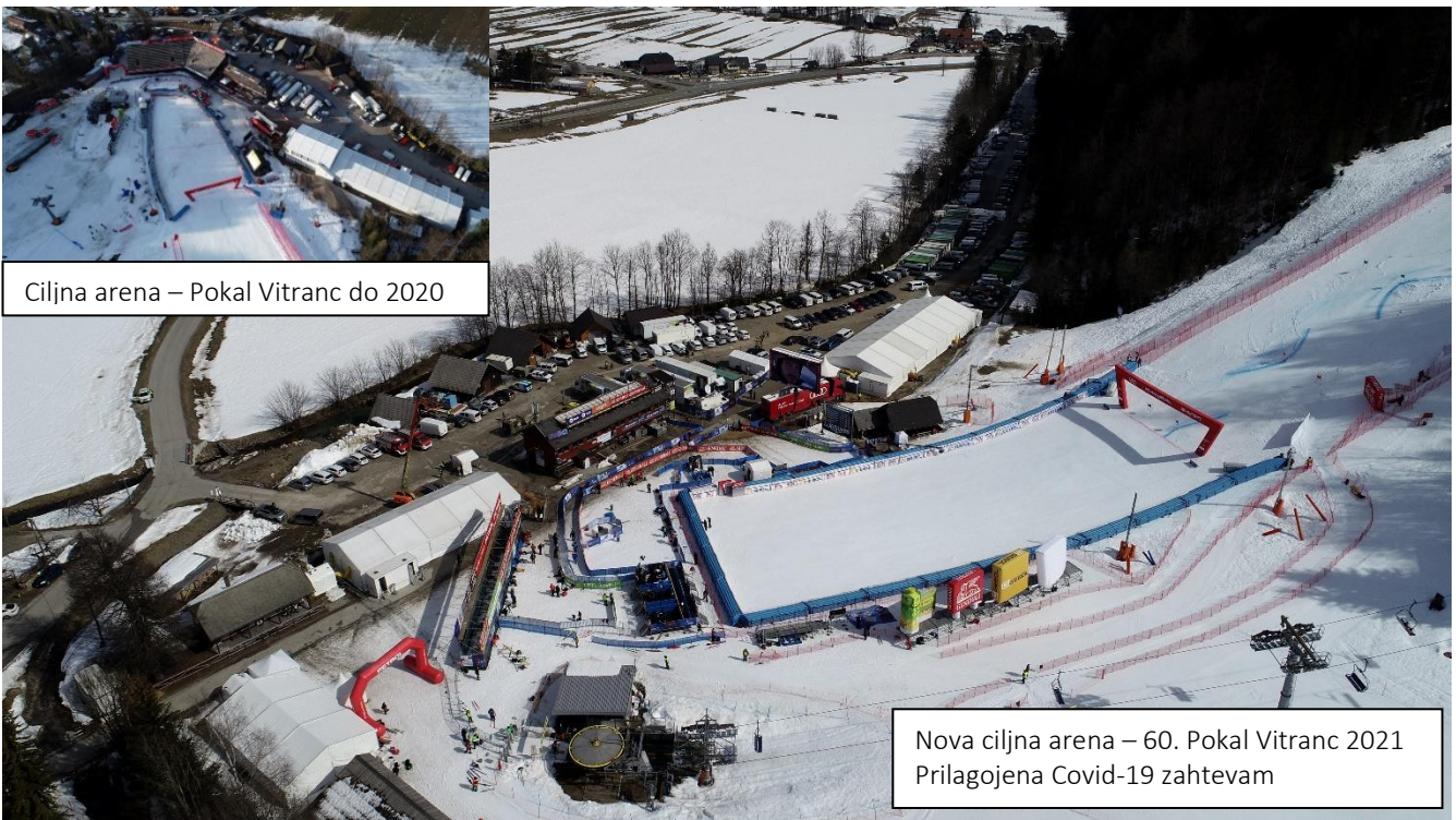
Ciljna arena – Pokal Vitranc do 2020

Glede na omejitve vlade RS in NIJZ, smo morali prilagoditi prizorišče, tako da je zadostilo zahtevam o vzpostavitvi celotnega prizorišča kot »enotnega varnega mehurčka (FIS Snowflake), s posameznimi pod-mehurčki«, ki so zagotavljali, da ni prihajalo do nepotrebnega mešanja različnih skupin udeležencev v ciljnem prostoru in na tekmovalni progi.